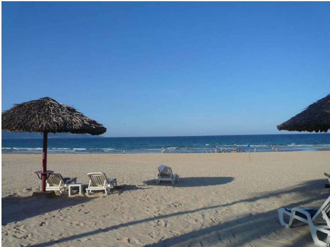
(ベトナム中部・ ダナン市の海岸)