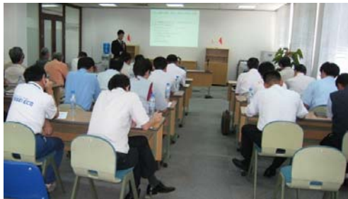
<野村ハイフォン工業団地会場>

野村ハイフォン工業団地での開催では同工業団地入居の25社、タンロン工業団地での開催では同工業団地入居の25社、JETRO ハノイセンターでの開催では上記2カ所以外の工業団地に入居されているお客さまやサービス業のお客さま60社の参加をいただき、人事・労務管理に関するお客さまの関心の高さがうかがわれました。また、野村ハイフォン工業団地では5名8件、JETRO ハノイセンターでは10名15件、タンロン工業団地では3名4件の質問が出され、参加者の皆様と講師およびパネラーとの間で活発な質疑応答が行われました。