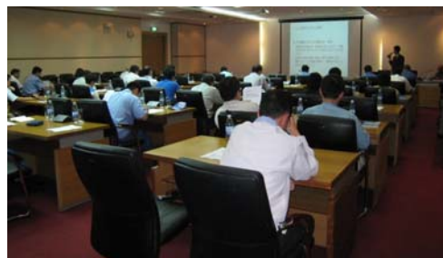
<タンロン工業団地会場>

給与水準に関して、各工業団地でのワーカーの標準的な賃金水準の説明、日本人並みに働くベトナム人への賃金水準の設定方法に関して両パネラーから説明が行われ、日本人並みに働くベトナム人にはその活躍に報いる適切な給与を出すことも必要であるとのアドバイスがなされました。また、日系企業の賃金改定に関する日系企業同士の情報共有が重要であることがアドバイスされました。